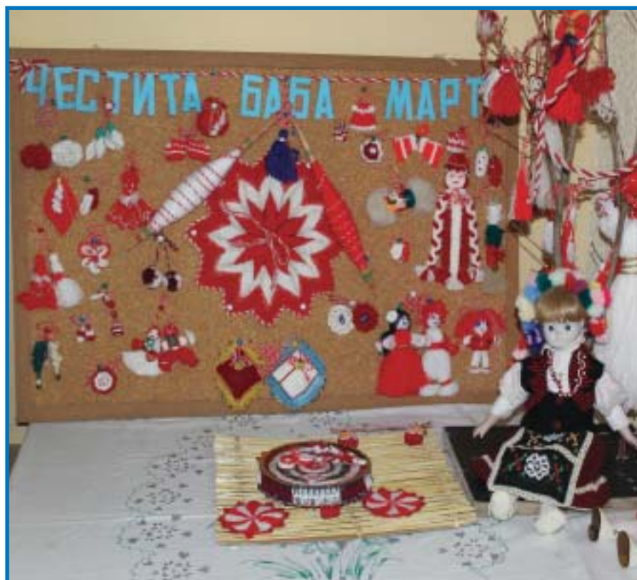
Таблото в читалището на с. Здравец е окичено с красиво изработени мартеници. Как посрещнаха Баба Марта в общината четете на 8 и 9 стр.

Заявления от кандидат-потребителите на услугата „личен асистент“ по Проект „Нови възможности за грижа“ Следва на 3 стр.